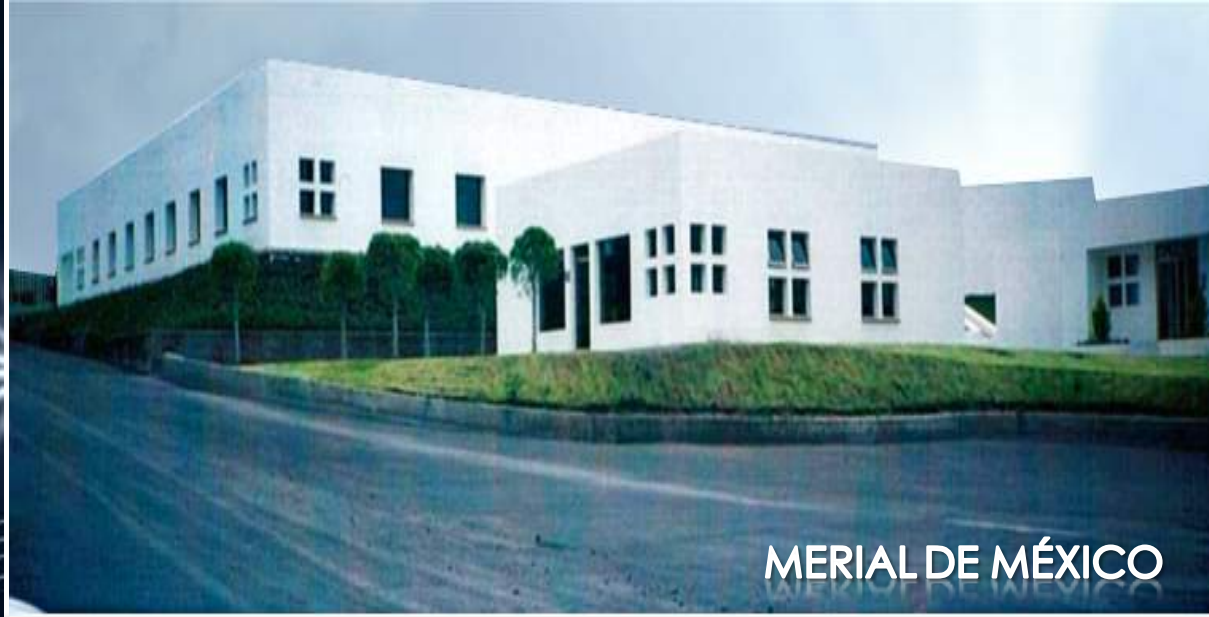
MERIAL DE MÉXICO