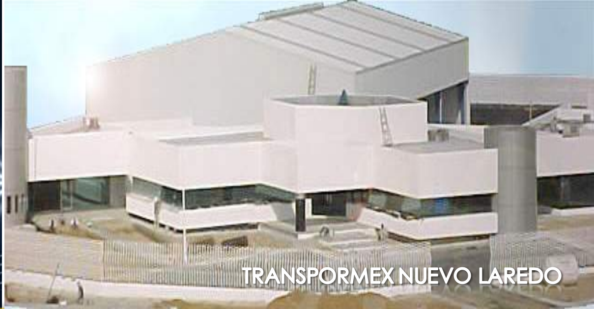
TRANSPORMEX NUEVO LAREDO