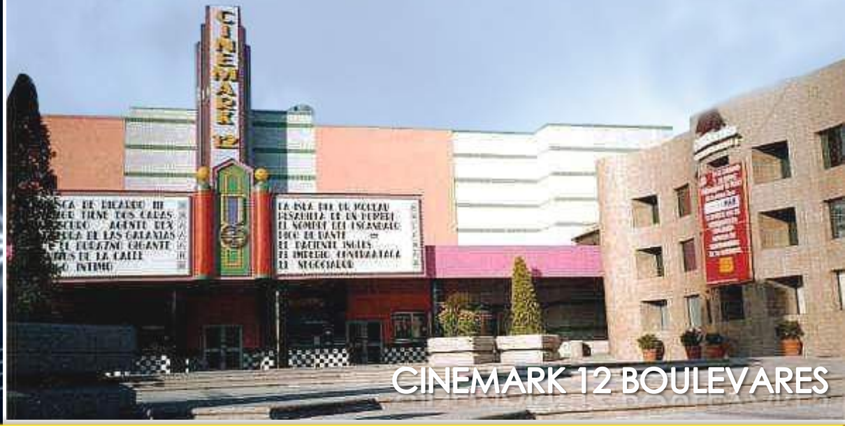
CINEMARK 12 BOULEVARES