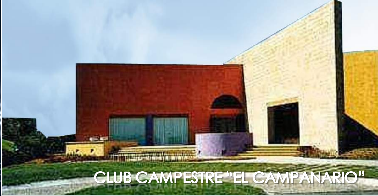
CLUB CAMPESTRE "EL CAMPANARIO"