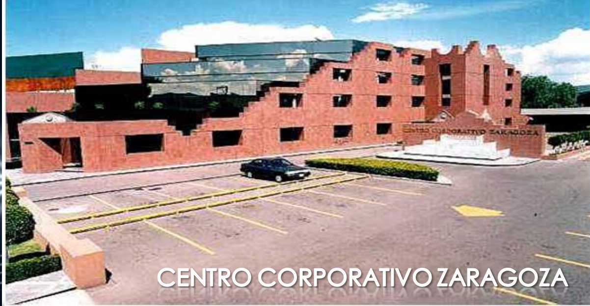
CENTRO CORPORATIVO ZARAGOZA