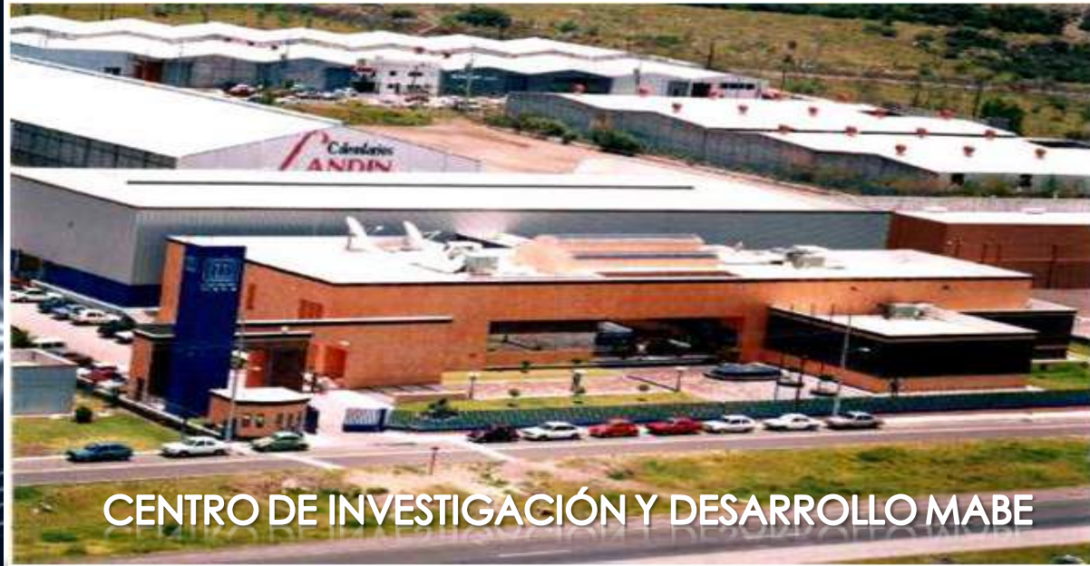
CENTRO DE INVESTIGACIÓN Y DESARROLLO MABE