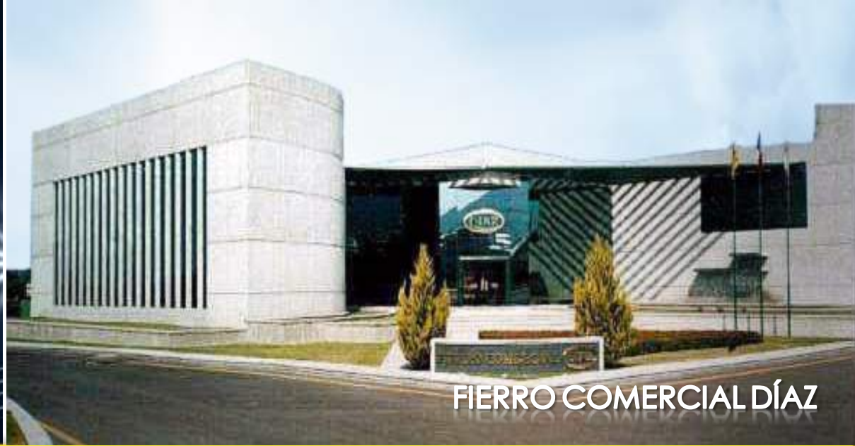
FIERRO COMERCIAL DÍAZ