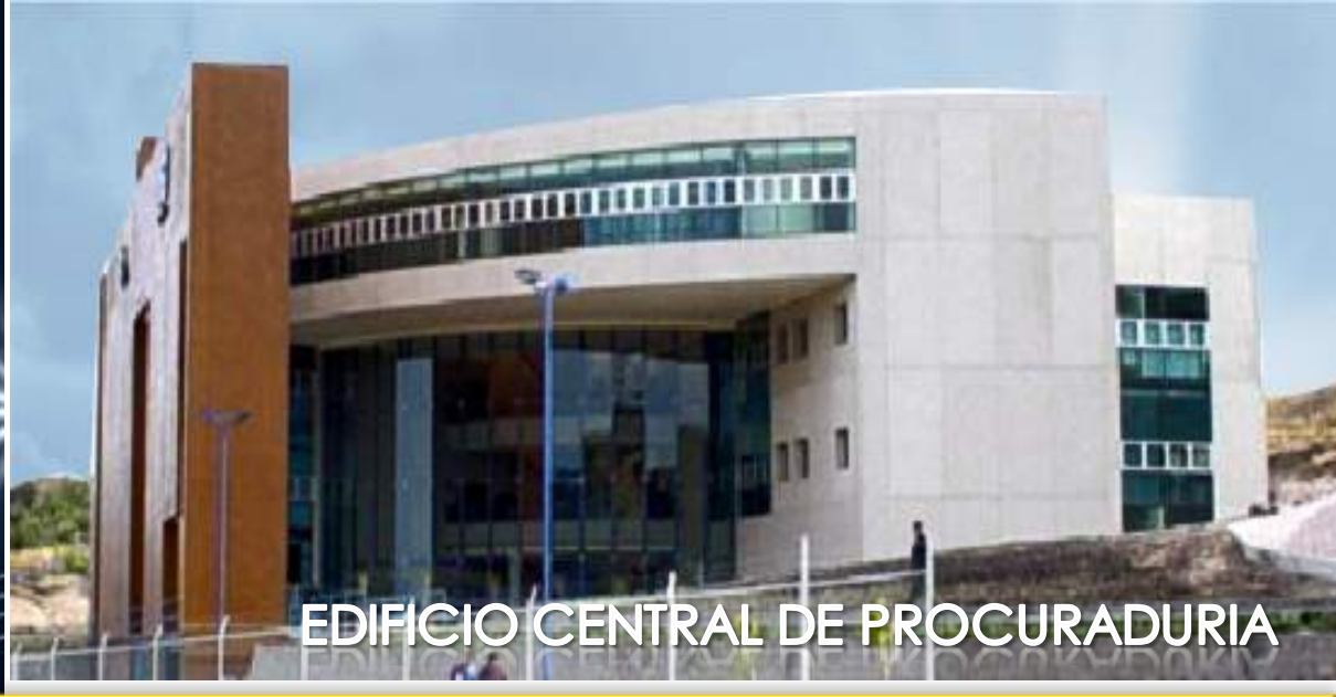
EDIFICIO CENTRAL DE PROCURADURIA